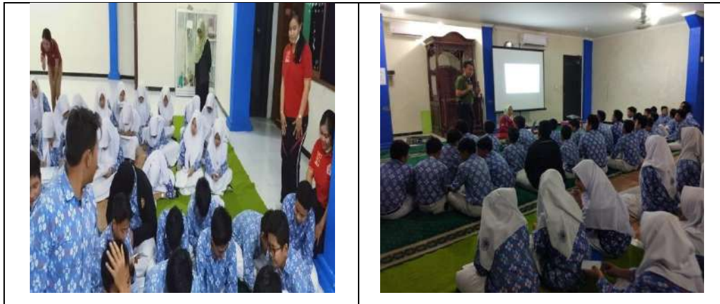
Gambar 2. Proses Pengisian Kuisisioner dan Pemberian Materi