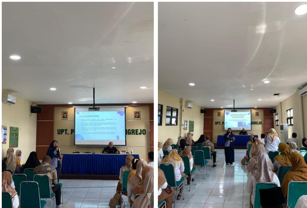
Gambar 1 Optimalisasi Manajemen Sumber Daya Manusia Sebagai Upaya Peningkatan Kinerja Tenaga Kesehatan Di Puskesmas Gondangrejo

Selanjutnya, disampaikan materi mengenai konsep dasar manajemen Sumber Daya Manusia (SDM) di bidang kesehatan, yang menjelaskan bahwa manajemen SDM merupakan proses perencanaan, pengorganisasian, pengarahan, serta pengendalian aktivitas tenaga kerja untuk mencapai tujuan organisasi. Tujuan utama dari manajemen SDM ini meliputi penempatan tenaga kerja sesuai dengan kompetensinya, menjaga motivasi dan kepuasan kerja, serta meningkatkan produktivitas dan kualitas layanan kesehatan. Materi berikutnya membahas komponen-komponen manajemen SDM, dengan penekanan bahwa pengelolaan SDM yang optimal menjadi kunci keberhasilan dalam memberikan pelayanan kesehatan berkualitas. Hal ini memerlukan komitmen dari pimpinan serta dukungan kebijakan dari pemerintah. Selain itu, evaluasi dan perbaikan manajemen SDM harus dilakukan secara terus-menerus. Kegiatan diakhiri dengan pengisian post-test untuk mengukur peningkatan pengetahuan tenaga kesehatan mengenai optimalisasi manajemen sumber daya manusia sebagai upaya meningkatkan kinerja mereka.